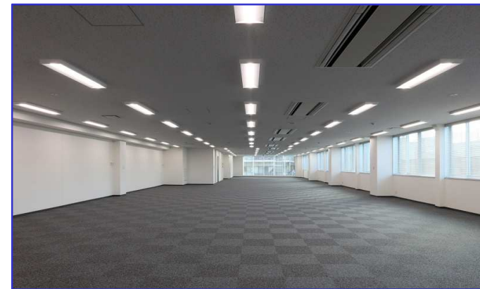
【エントランスホール】