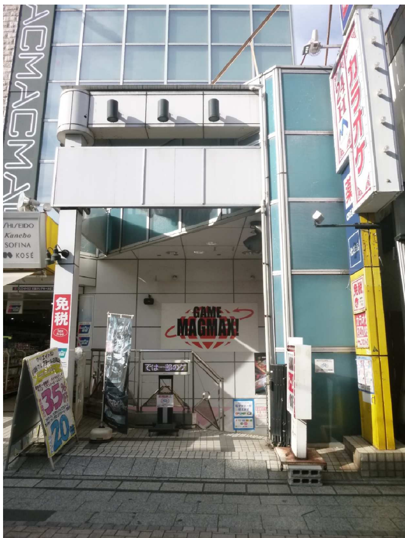
クリアモール街・地下1階店舗入口専用階段